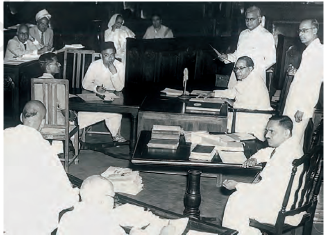
संविधान सभा में चर्चा की अध्यक्षता करते हुए डॉ. बी.आर. अंबेडकर