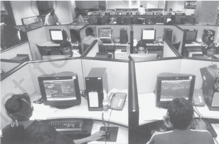
चित्र 3.2 सूचना प्रौद्योगिकी उद्योग का भारत के निर्यात में प्रमुख योगदान

औचित्य नहीं है, क्योंकि विश्व व्यापार का अधिकांश भाग तो विकसित देशों के बीच ही होता है। उनका यह भी मानना है कि विकसित देश अपने देशों में जहाँ कृषि सहायिकी दिये जाने को लेकर शिकायत करते हैं, वहीं विकासशील देश अपने बाजारों को विकसित देशों के लिए खोले जाने को मजबूर करने को लेकर छला हुआ महसूस करते हैं। वे देश विकासशील देशों को अपने बाजारों में किसी न किसी बहाने प्रवेश करने से रोकने का प्रयास भी करते रहते