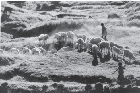
चित्र 6.3 ग्रामीण क्षेत्रों में भेड़ पालन आय वृद्धि का महत्वपूर्ण स्रोत है

पर्यटन आदि सम्मिलित हैं। कुछ ऐसे क्षेत्रक भी हैं जिनमें संभावनाएँ तो विद्यमान हैं, पर जिनके लिए संरचनात्मक सुविधाएँ तथा अन्य सहायक कार्यों का नितांत अभाव है। इस वर्ग में हम परंपरागत गृह उद्योगों को रख सकते हैं जैसे, मिट्टी के बर्तन बनाना, शिल्प कलाएँ, हथकरघा आदि। यद्यपि, अधिकांश ग्रामीण महिलाएँ कृषि में रोजगार प्राप्त करती हैं, जबकि पुरुष गैर-कृषि रोजगार की तलाश में हैं। किंतु, हाल के वर्षों में ग्रामीण महिलाएँ भी गैर कृषि कार्यों की ओर अग्रसर होने लगी हैं (देखें बॉक्स 6.2)।