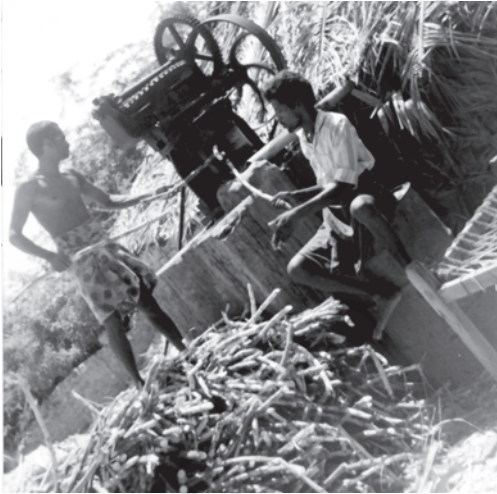
चित्र 6.2 गुड़ निर्माण कृषि क्षेत्रक का एक संबद्ध क्रियाकलाप है

आवश्यकता इसलिए उत्पन्न हो रही है, क्योंकि सिर्फ खेती के आधार पर आजीविका कमाने में जोखिम बहुत अधिक हो जाता है। अतः विविधीकरण द्वारा हम न केवल खेती से जोखिम को कम करने में सफल होंगे बल्कि ग्रामीण जन समुदाय को उत्पादक और वैकल्पिक धारणीय आजीविका