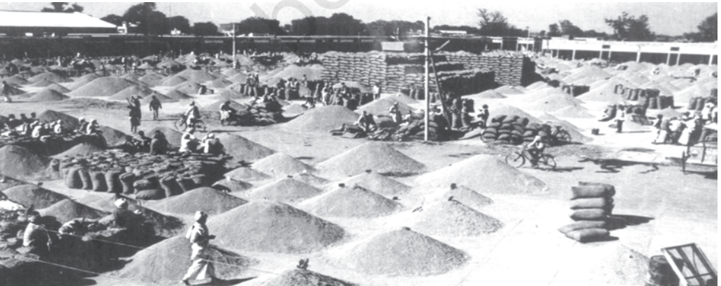
चित्र 6.1 नियमित अनाज मंडियाँ किसानों और उपभोक्ताओं को लाभ पहुँचाती हैं

स्वतंत्रतापूर्व व्यापारियों को अपना उत्पादन बेचते समय किसानों को तोल में हेरा फेरी तथा खातों में गड़बड़ी का सामना करना पड़ता था। प्रायः किसानों को बाजार में प्रचलित भावों का पता नहीं होता था और उन्हें अपना माल बहुत