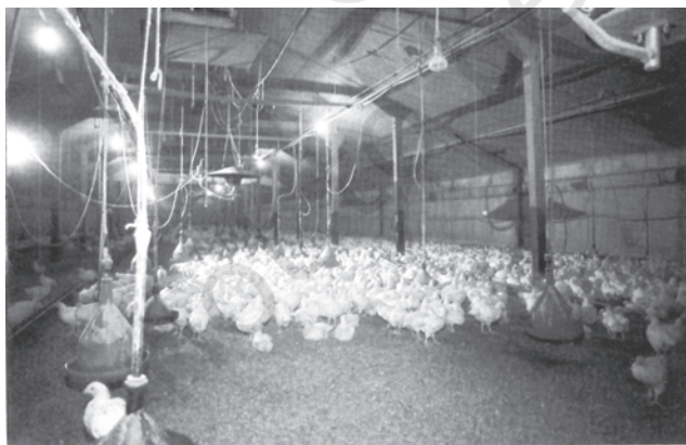
चित्र 6.4 भारत में मुर्गी पालन का पशुधन में सबसे अधिक भाग है

मत्स्य पालन: मछुआरों के समुदाय तो प्रत्येक जलागार को 'माँ' या 'दाता' मानते हैं। सागर-महासागर, सरिताएँ, झीलें, प्राकृतिक तालाब, प्रवाह आदि सभी जलागार मछुआरों के समाज के लिए निश्चित जीवन दीपक स्रोत बन जाते हैं। भारत में बजटीय प्रावधानों में वृद्धि और मत्स्य पालन एवं जल कृषिकी में नवीन प्रौद्योगिकी के प्रवेश के बाद से मत्स्य उद्योग ने विकास की नई मंजिलें तय की हैं। आजकल देश के समस्त मत्स्य उत्पादन का 65 प्रतिशत अंतर्वर्ती क्षेत्रों से तथा 35 प्रतिशत महासागरीय क्षेत्रों से प्राप्त हो रहा है। यह मत्स्य उत्पादन सकल घरेलू उत्पाद का 0.9 प्रतिशत है। मत्स्य उत्पादकों में प्रमुख राज्य पं. बंगाल, केरल, गुजरात, महाराष्ट्र